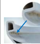
従来の便器断面 (ボックスリム形状)

お掃除のしやすさを究めたデザイン。奥までぐるっとフチがないから、サッとひとふき、お掃除超ラクです。