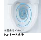
※画像はイメージ トルネード洗浄