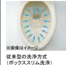
※画像はイメージ 従来型の洗浄方式 (ボックスリム洗浄)

渦を巻くようなトルネード洗浄で便器の中をぐるりとしっかりと洗浄。少ない水で効率よく洗います。